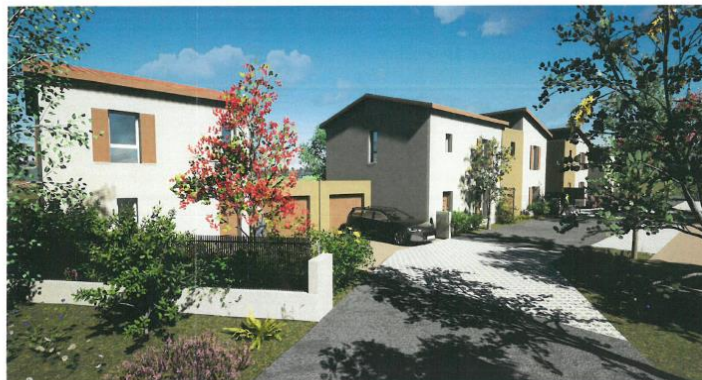
Vue de l'entrée du lotissement.